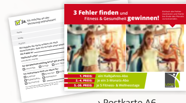
› Postkarte A6