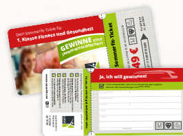
› Promotionkarte DL

Nutze diese Kampagne für Promotion-Aktionen an stark frequentierten Standorten. Mit dem lustig gewählten Thema gelingt die Ansprache der Interessenten wie von selbst!