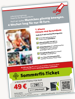
› Flyer A4

Du hast bei allen individuellen Werbemitteln die Wahl zwischen diesen 3 Motiven: