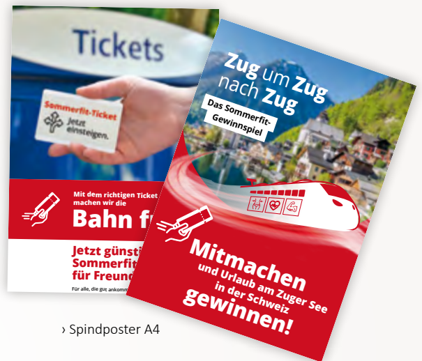
› Spindposter A4

Die Studio-Poster sind abwechslungsreich mit lustigen Wortspielen und sorgen garantiert für einen Hingucker und einen Lacher!