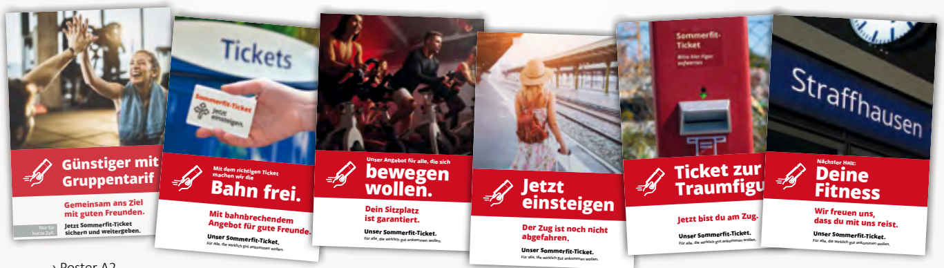
› Poster A2

Eine runde Sache: Das passende Briefpapier inkl. Kuverts verleiht deiner Kampagne den letzten Schliff und ein professionelles und rundes Auftreten.