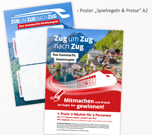
› Poster „Spielregeln & Preise“ A2

Die Spielregeln und Preise legst du ganz individuell fest. Im Spieler-Poster kannst du die Laufzeit, die Punktwertung und die Preise deines Sommerspiels eintragen. Viele Ideen dazu erhältst du von deinem persönlichen Berater!