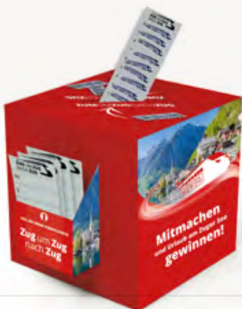
› Losbox mit Streifenkartenhalter

Belohne deine Mitglieder für jede Empfehlung großzügig: Für jeden Teilnehmer an der Sommeraktion gibt es zusätzliche Stempel. Für jedes geworbene Neumitglied wird die Karte vollständig abgestempelt und kommt direkt in die Losbox.