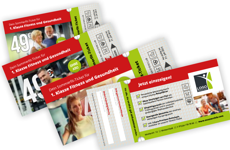
› Sommerfit-Ticket (Gutschein für Freunde)

Diese werden individuell mit deinem Angebot gestaltet. Bestellung in deiner gewünschten Auflage über den digitalen Bestellschein im Admin-Portal: https://adminportal.aciso-suite.com